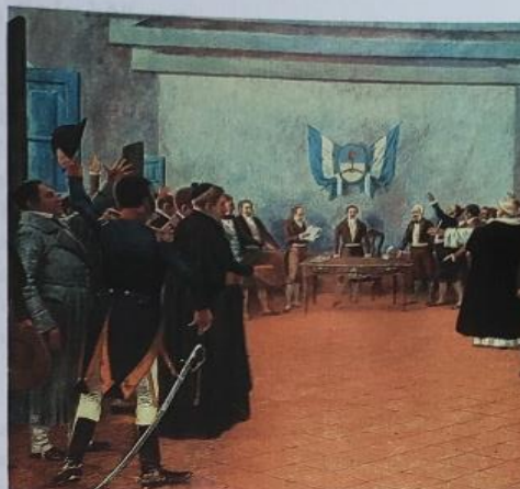
Declaración de la independencia en 1816.

A fines de 1815, la restauración en el trono de Fernando VII aceleró el proceso revolucionario. Un Congreso Constituyente reunido en Tucumán declaró la independencia en 1816 . En 1819, se sancionó una Constitución, que fue rechazada por las provincias por sus características centralistas y aristocratizantes.